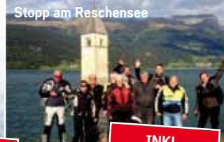
Stopp am Reschensee