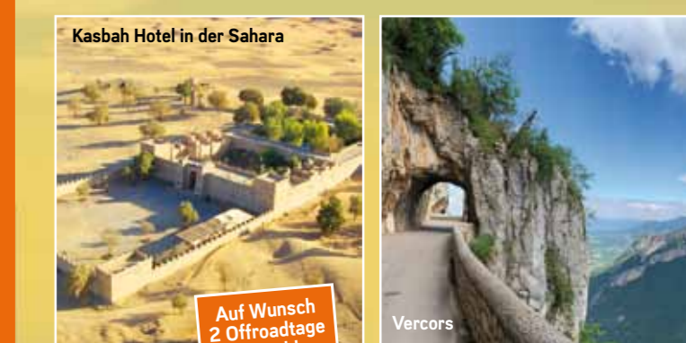
Kasbah Hotel in der Sahara