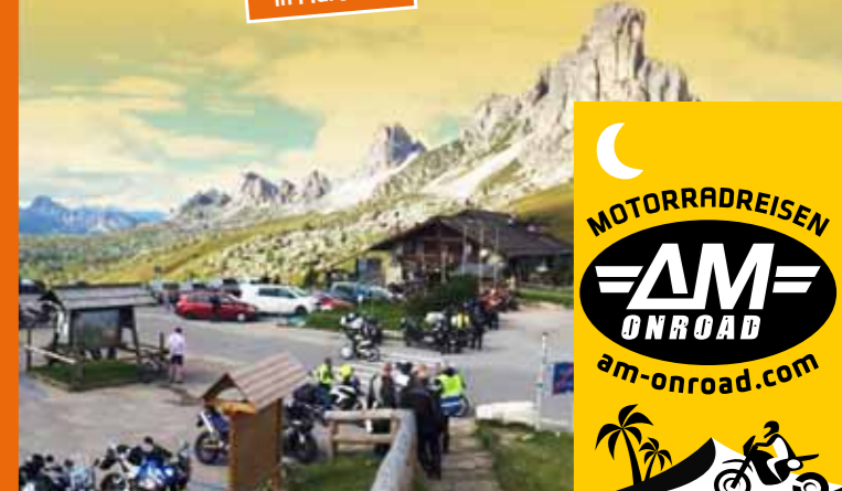
Passo di Giau, Dolomiten