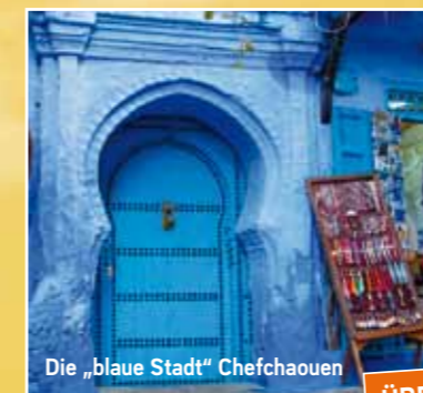
Die „blaue Stadt“ Chefchaouen