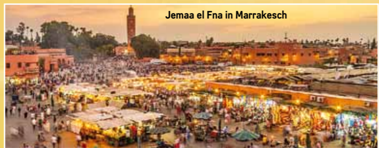
Jemaa el Fna in Marrakesch

Diese Reise bietet einen Querschnitt dessen, was man sich von Marokko erwartet: Faszinierende Landschaften vom türkisfarbenen Mittelmeer, den weiten Hochebenen des Mittleren Atlas bis zu den tiefen Felsschluchten und Canyons im Hochgebirge. Wir genießen die Sanddünen der Sahara und die Palmoasen des Südens und erreichen schließlich die tosende Brandung an der Atlantikküste. Wir tauchen ein in das bunte Leben der exotischen Städte wie der Königsstadt Marrakesch, der „blauen Stadt“ Chefchaouen im Rif-Gebirge, der Atlantikhäfen Essaouira und Asilah. Stressfreies Motorradfahren pur auf den schönsten Strecken im Hochgebirge, in weiten Steppenlandschaften auf geschwungenen Landstraßen durch die Wüste, entlang am Atlantik ... Fahrspaß pur.